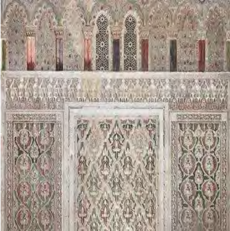
La synagogue El Tránsito à Tolède, (Espagne), 11 décembre 2017 Photographie Espagne, David Blázquez © David Blázquez

Vestiges archéologiques, manuscrits anciens, peintures, textiles, objets liturgiques, photographies, pièces musicales et installations audiovisuelles... Ces pièces d'exception révèlent un patrimoine profane et religieux d'une remarquable richesse. Elles illustrent aussi les liens profonds qui ont uni juifs et musulmans pendant des siècles.