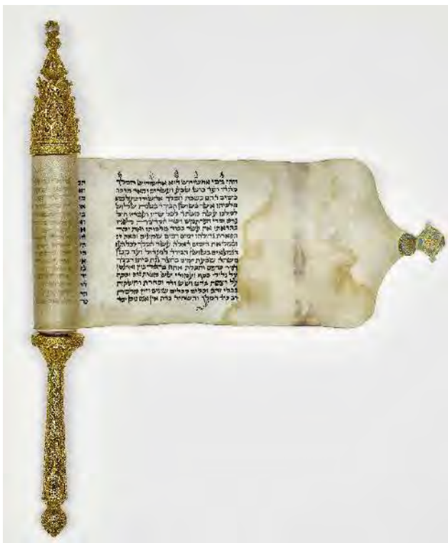
Étui parchemin d'Esther, probablement Istanbul, vers 1875. Argent partiellement doré, repoussé, ciselé, poinçonné 281 g. Tel-Aviv, collection privée William L. Gross

Dernier volet de la trilogie consacrée aux religions monothéistes, " Juifs d'Orient présentée à l'Institut du monde arabe (IMA) rappelle l'interaction historique des communautés juive et arabe en terre sainte. Transmission et espoir sont les maîtres-mots de cette exposition.