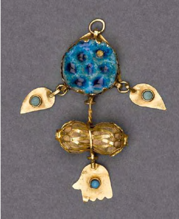
Amulette, Irak, vers 1925. Or sur bois, taillé, gravé, serti de céramique et pierre. Tel-Aviv, collection privée William L. Gross

L'exposition propose de découvrir ces lieux emblématiques à travers une sélection d'objets d'art, peintures, photographies et films qui retracent des situations vécues par les populations juives en terres d'islam, de l'Antiquité à nos jours.