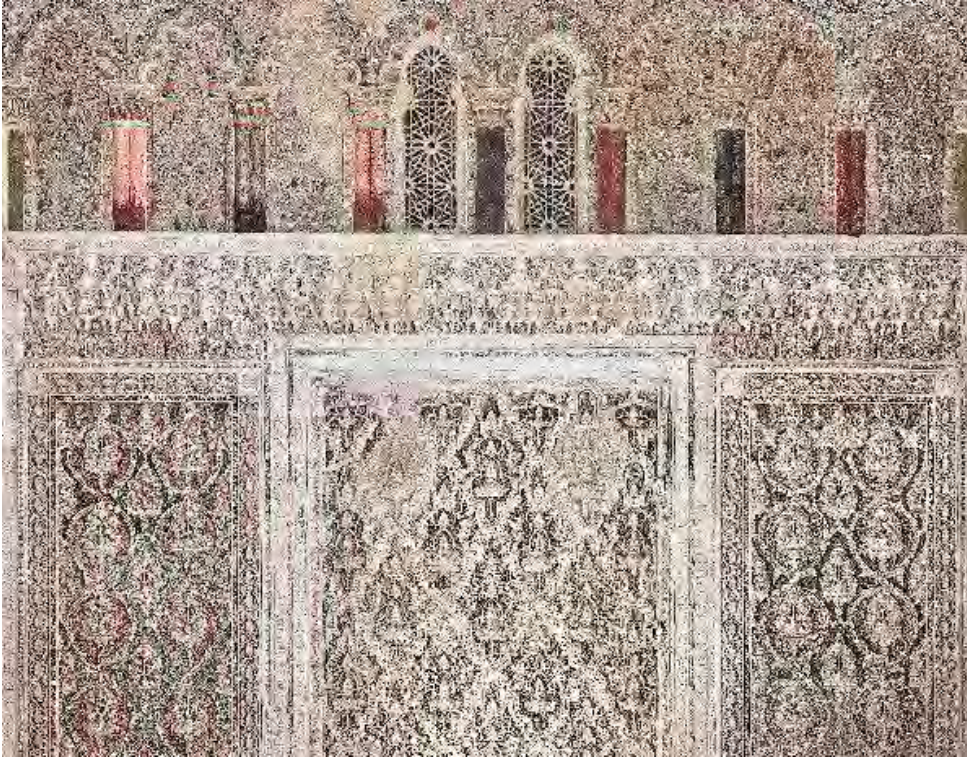
La synagogue El Tránsito à Tolède, Espagne, 11 décembre 2017.