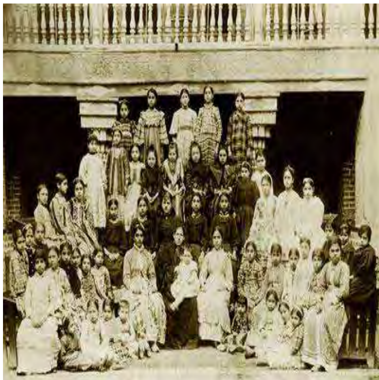
Ecole de filles à ses débuts, Bagdad, 1900 Tirage moderne Paris, bibliothèque de l'Alliance Israélite Universelle, 165

Le Président de l' Institut du Monde Arabe, Jack Lang , et ses équipes ont su convaincre les grands musées internationaux, ( British Museum, Musée archéologique de Rabat, Brooklyn Museum, Israël Museum à Jérusalem ...) et les grandes institutions françaises ( Musée d'Art et d'Histoire du judaïsme, Musée du Louvre, Bibliothèque nationale de France, Musée d'Orsay... ) de prêter des oeuvres, qui, pour certaines sont présentées pour la première fois en Europe .