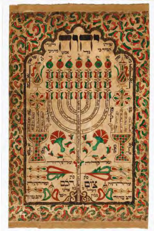
Shiviti Adonai le Negdi Tamid, Maroc, vers 1850. Encre et peinture sur papier. Tel-Aviv, collection privée William L. Gross

Cette section offre un magnifique focus sur Chagall, Moïse recevant les tables de la Loi (Moïse à la source) [1950/52, Paris, musée national d'art moderne]. Dès l'Antiquité Moïse est le prophète le plus fréquemment représenté dans l'iconographie biblique, puisque Dieu ne peut pas l'être. Ici, le peintre respecte cette interdiction et le symbolise par deux mains sortant des nuages. Moïse, vêtu de blanc, porte sur son front les rayons de lumière.